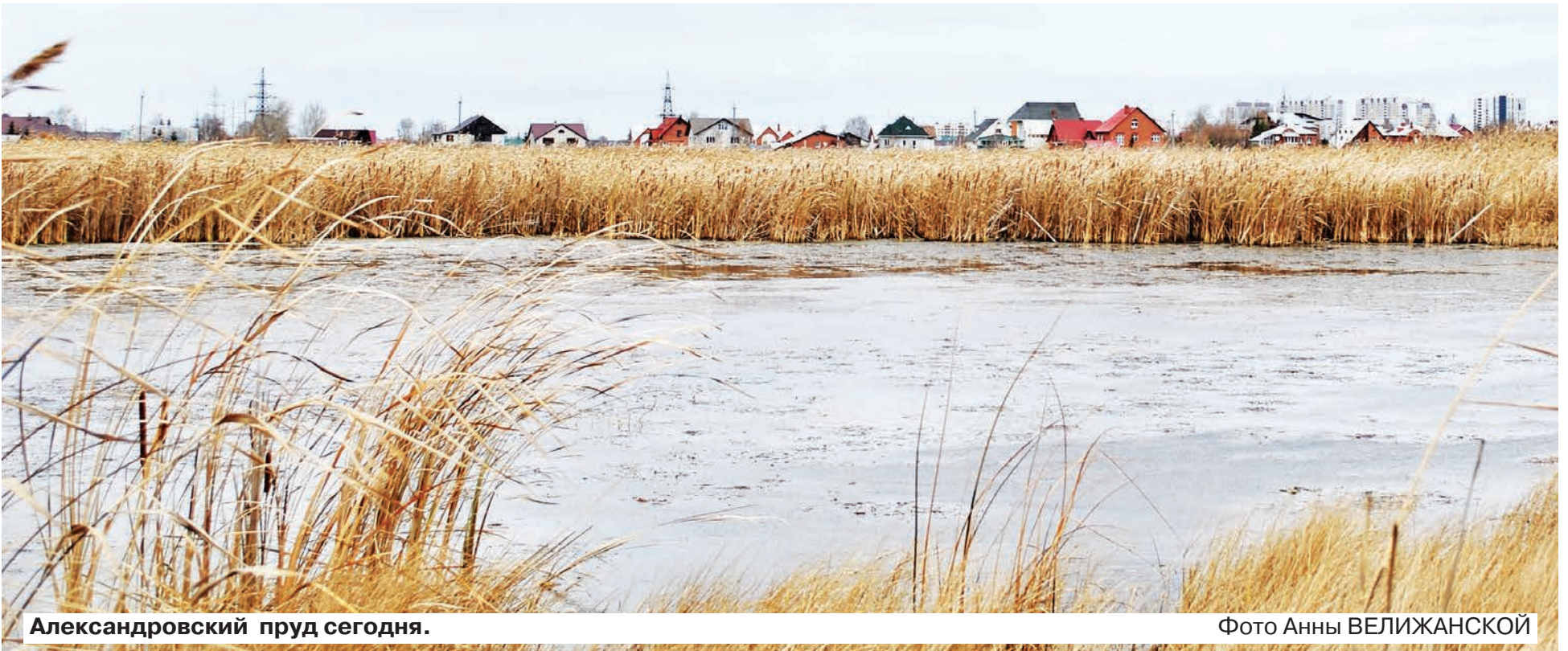
Александровский пруд сегодня.