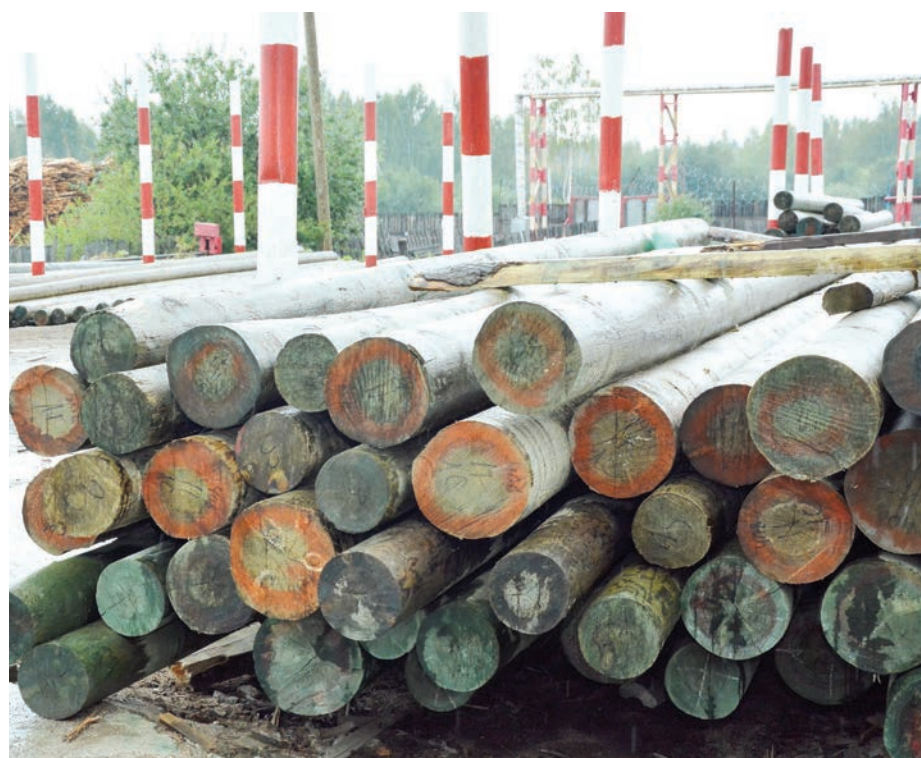
На производственной площадке ГК «Лесозавод» в Монетном