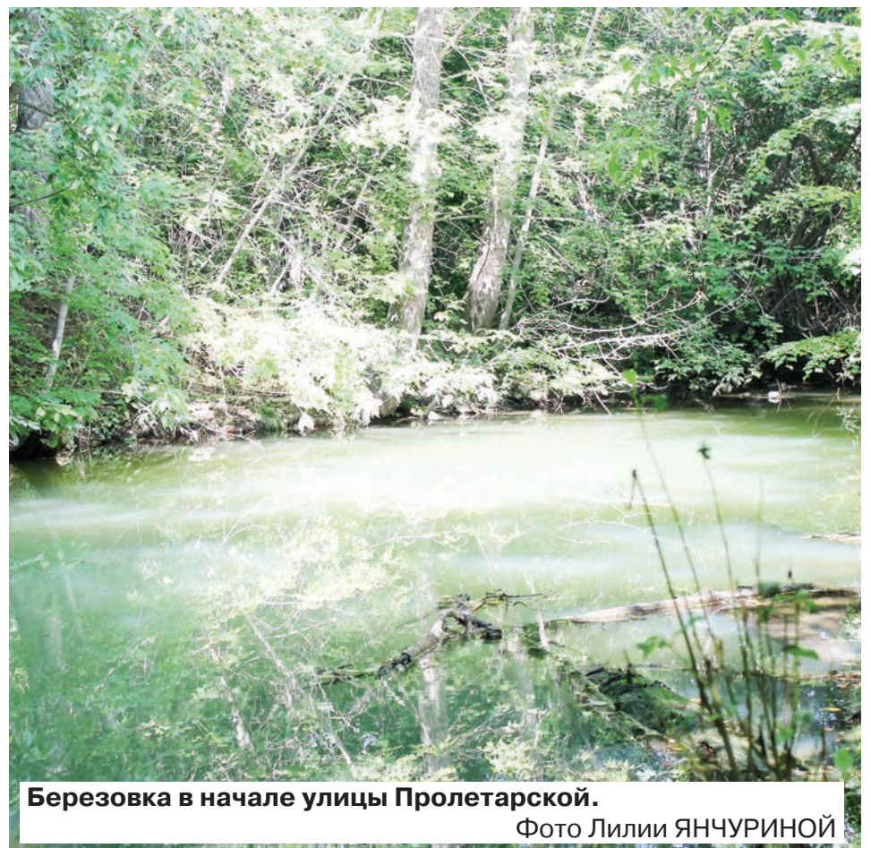
Берёзовка в начале улицы Пролетарской.

Все мы чувствуем, что воздух Екатеринбурга и Берёзовского загрязнен, в том числе выхлопными газами автомобилей. В безветренную погоду МЧС нас предупреждает о смоге, опасном для здоровья. Значительны проблемы и с чистотой воды. В прошлые времена птицы в клетке в шахте, перестав щебетать, говорили: «Уходи, опасно!». А сейчас журавли кружат над Александровским прудом с осуждающим человеческое равнодушие криком: «Люди, что вы делаете? Вы вредите не только нам – в первую очередь себе и тем, кто будет жить в этих местах завтра!». Одни птицы садятся в надежде найти корешок или лягушку, другие, махнув крылом, пролетают мимо.